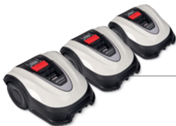
04 HRM 40 / 40 LIVE / 70 LIVE