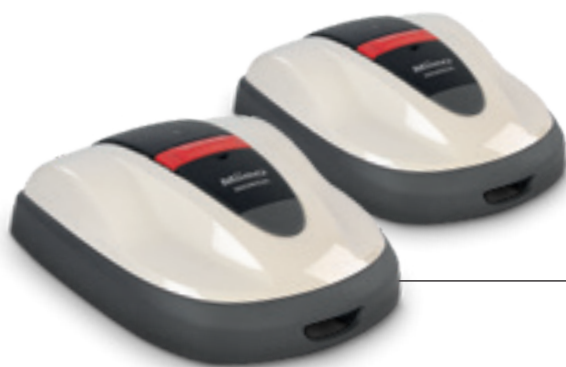
07 HRM 310 / 520