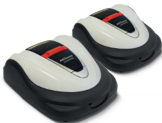
08 HRM 3000 09 HRM 3000 LIVE