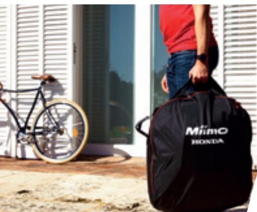
HOUSSE DE TRANSPORT MIIMO

Une large gamme d'accessoires est disponible afin que Miimo vous simplifie la vie.