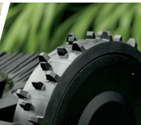
ROUES À HAUTE TRACTION