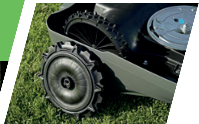
ROUES À HAUTE TRACTION