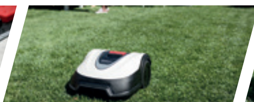
SCHÉMA DE TONTE LOGIQUE

Beau temps, mauvais temps, la conception étanche IPX4 de Miimo lui permet d'affronter la plupart des mauvaises conditions météorologiques.