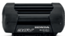
36V 6,0 Ah DP3660XA