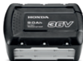
36V 9,0 Ah DPW3690XA