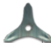
Couteau 3 dents

Une gamme d'accessoires polyvalents est disponible pour l'ensemble de la gamme.