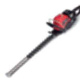
HHH 36 AXB