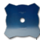
Couteau 4 dents**

**Lame 4 dents uniquement disponible sur les modèles avec guidon.