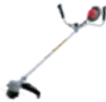
HHT 36 AXB