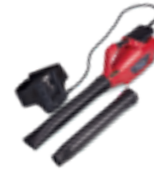
HHB 36 AXB