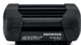
36V 4,0 Ah DP3640XA

Une sélection de batteries Li-ion universelles Honda pour la gamme d'outils à batterie.